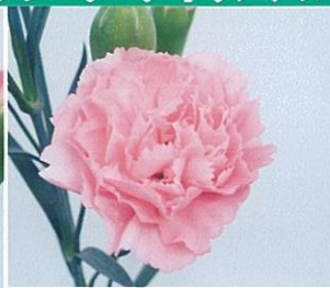
キャッスルピンク