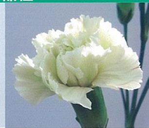
グリーンキャッスル