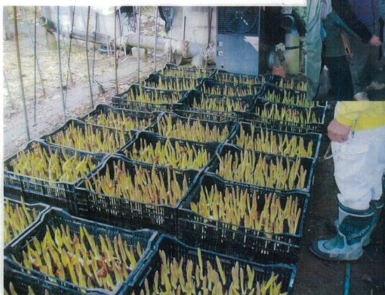
栽培中の NZ 産チューリップ