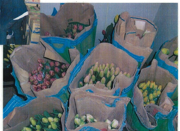
収穫されたチューリップ切花