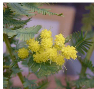
一般消費者用フラワーフードを使用すると開花が進む