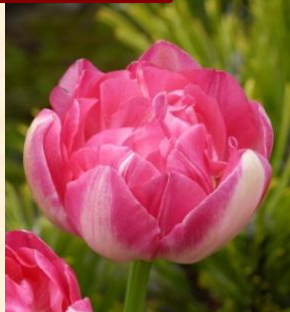
アッフストライフ