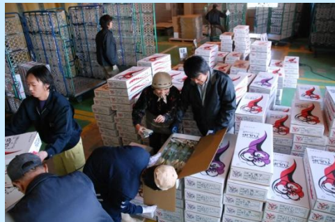
厳重に規格を検査